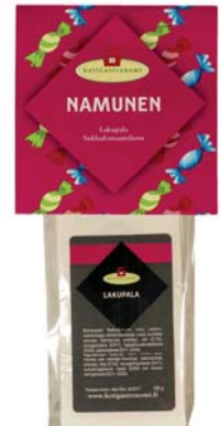
Namunen: Lakupala 180 g, Suklaabanaanilastu 180 g