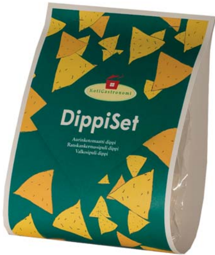
DippiSet: Aurinkotomaatti 60 g, Ranskan-kerma-sipuli 50 g, Valkosipuli 50 g