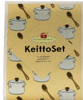
KeittoSet: Herkkusienikeitto 80 g, Juustokeitto 75 g, Savulohikeitto 65 g