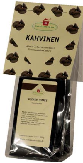
Kahvinen: Wiener Toffee maustekahvi 80 g, Tummasuklaa Cashew 150 g

Kotigastronomi-tuotteita yli 20 vuoden kokemuksella!