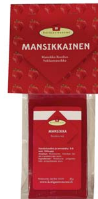
Mansikkainen: Mansikka Rooibos 60 g, Suklaamansikka 150 g