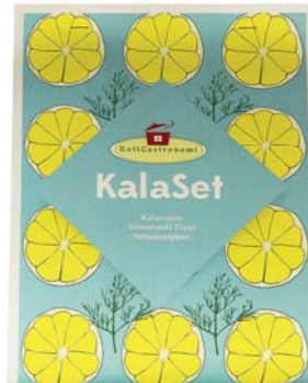
KalaSet: Kalamauste 100 g, Sitruuna-tilli Dippi 60 g, Sitruunapippuri 70 g