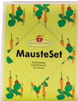
MausteSet: Jauhelihamauste 120 g, Broilerimauste 120 g, Pizzamauste 35 g

Kahvi/tee/makeiset on pakattu aromipusseihin ja sellofaaniin.